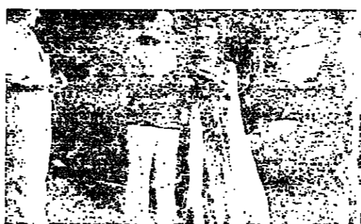
بعد عام من زواجها الثاني من بورنون

لا يمر عام الا وتزوج المزيات نابور من جديد . فسواء ظلت او اوقمت احدا في حياتها تبقى الممثلة التي تجتنب الصحافة المأجبة . وفي الواقع ، فبعد عودتها الى ويشارد بورنون ، تطلعت ليز بزواجها السابع من جون وارنر (٤٩ عاما) هومو رجل لا يملك شيئا في عالم الاضواء والسينما . هومو سياسية ، وشغل في مرة من المرات ، مسكرير دولة . ولقاء ليز بزواجها الجديد كان حدثا بعد ذاته ، اذ تكللا في حفل يملكه جون مساحته ١٠٠٠ هكتار نسي ولاية فرجينيا ، ويميدا عن انظار المعجبين ونحت اعين الكليقة التي ترضي فيها الحيوانات الداجسة ( الصورة ) .